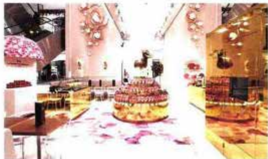
Tapis de l'atrium du Printemps. Technique: Hand tufté; matière: 100 % laine.